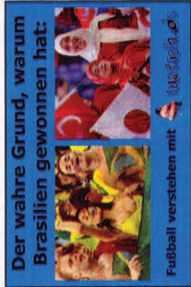
Der wahre Grund, warum Brasilien gewonnen hat: