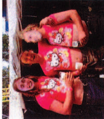
Danke auch an unseren Fanclub, der uns bei jedem Spiel unterstützt!

Viel wichtiger ist, dass wir uns als Truppe bereits 15 Jahre gehalten haben - und darauf trinken wir jetzt. PROBST RÜCKWÄRTS RIEDAU - PROBST JUNGS!!!!